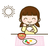
朝 ごはんを食べる時間