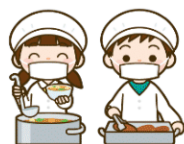
昼 きゅう食の時間