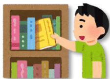
と も 【手に取る、持つ】